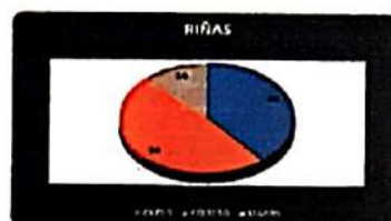
Tabla No. 2 Informe de las llamadas a la línea 123 durante el periodo de cuarentena obligatoria