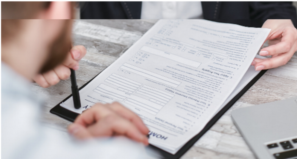
El principal objetivo es acercar además la información sobre la importancia de contar con un seguro

Es necesario fortalecer el sector a fin de crear conciencia en el ciudadano, sobre la importancia de contar con protección